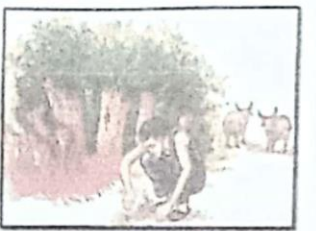
เลี้ยงปศุสัตว์