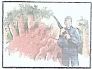
ล่าสัตว์