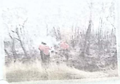
ไฟ ใต้ดิน

การแบ่งชนิดของไฟป่าที่ได้รับการยอมรับและใช้กันมา ยาวนานนั้น ถือเอาการไหม้เชื้อเพลิงในระดับต่างๆ ในแนวตั้ง ตั้งแต่ระดับชั้นดินขึ้นไปจนถึงระดับยอดไม้ เป็นเกณฑ์ การแบ่งชนิดไฟป่าตามเกณฑ์ดังกล่าว ทำให้แบ่งไฟป่า ออกเป็น 3 ชนิด คือ ไฟใต้ดิน ไฟผิวดิน และไฟเรือนยอด