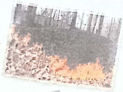
ไฟ ผิวดิน