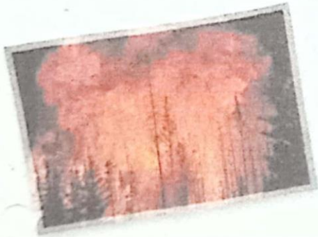
ไฟ เรือนยอด