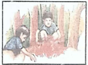
ความคึกคะนอง