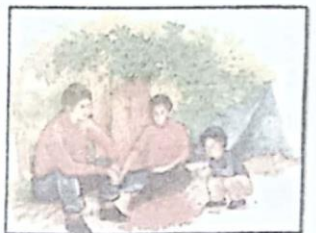
ความประมาท