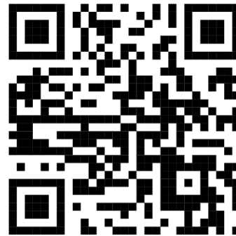
google forms แบบสอบถามความคิดเห็นเกี่ยวกับ ร่างเทศบัญญัติเทศบาลตำบลป่าซาง เรื่อง การจัดการสิ่งปฏิกูล พ.ศ.๒๕๖๘